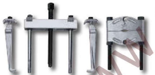
Puente + guillotina + patas Push puller + splitter + jaws